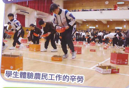
學生體驗農民工作的辛勞