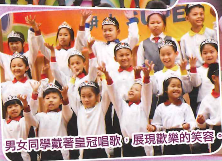
男女同學戴著皇冠唱歌，展現歡樂的笑容。