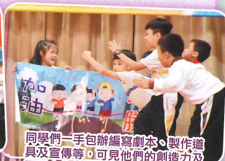
同學們一手包辦編寫劇本、製作道具及宣傳等，可見他們的創造力及團隊合作精神。