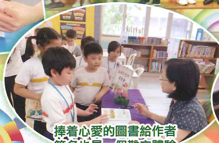
捧著心愛的圖書給作者簽名也是一個難忘體驗