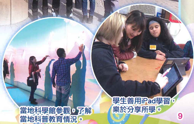
學生善用iPad學習，樂於分享所學。