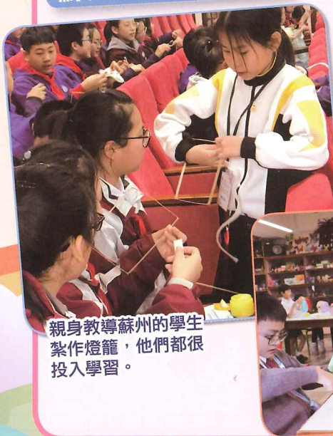
親身教導蘇州的學生製作燈籠，他們都很投入學習。