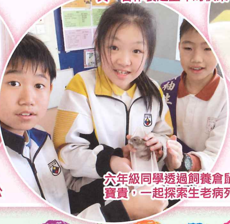
六年級同學透過飼養倉鼠，體驗生命的寶貴，一起探索生老病死的歷程。