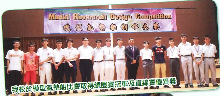
我校於模型氣墊船比賽取得繞圈賽冠軍及直線賽優異獎