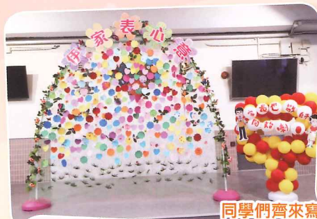
同學們齊來寫心意卡