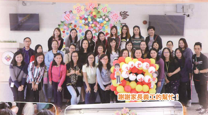
謝謝家長義工的幫忙！

本年度的敬師活動得以順利進行，有賴家長們的支持。除了有家長填寫的敬師卡外，學生都很踴躍送上心意卡，以答謝老師的付出和照顧。本年度作新嘗試，由十多位家長義工主持及製作的「伊分真的愛你點唱站」節目，讀出家長們的心聲。看看活動花絮：