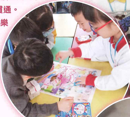
搜集有關香港傳統兒時玩意，同學動手設計屬於自己的玩具，合作製造童年的快樂。