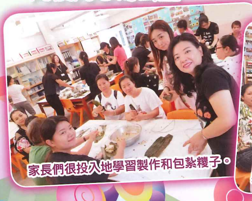
家長們很投入地學習製作和包紮糶子。