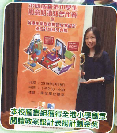
本校圖書組獲得全港小學創意閱讀教案設計表揚計劃金獎