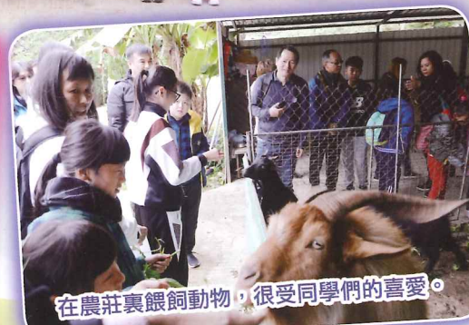
在農莊裏餵飼動物，很受同學們的喜愛。