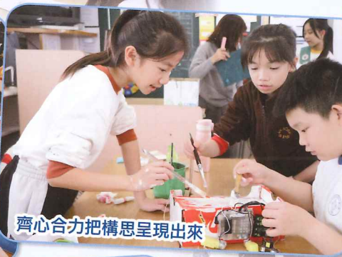
齊心合力把構思呈現出來