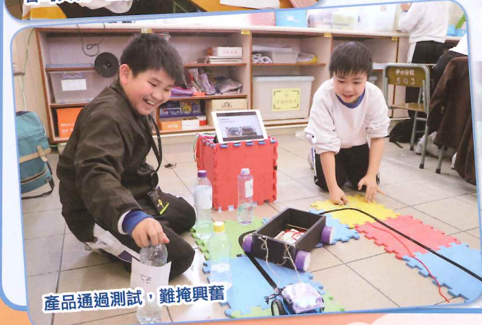
產品通過測試，難掩興奮