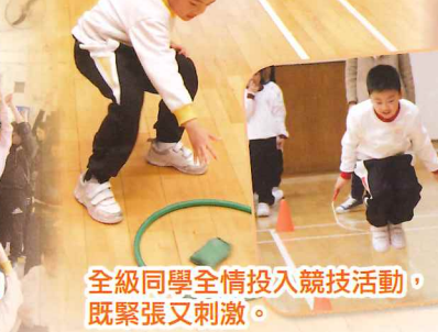
全級同學全情投入競技活動，既緊張又刺激。