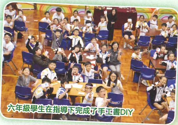
六年級學生在指導下完成了手工書DIY

本校圖書科課程備受肯定，本年更有幸獲得全港小學創意閱讀教案設計表揚計劃金獎！未來圖書組將推行更多推廣閱讀風氣的學習活動。