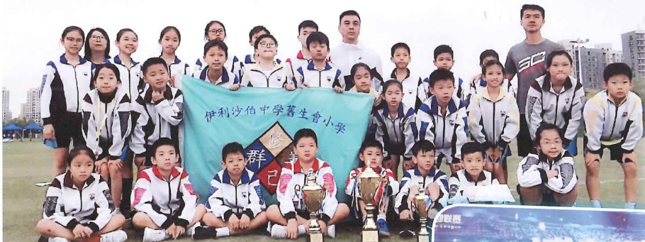
經過一天激烈的比賽，我校獲得U10組（10歲）冠軍，U11組（11歲）亞軍與及U13組（13歲）第8名的佳績。

本校欖球隊因在香港學界比賽表現出色，受到上海市體育局邀請，到上海參加「第三屆浦東高行·森蘭杯中外青少年橄欖球邀請賽」。在家長的全力支持及信任下，本校共有二十八名學生參與盛事，在各組別更獲得佳績。