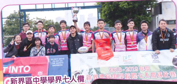
新界區中學學界七人欖球賽頒獎合照