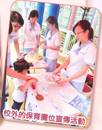
校外的保育攤位宣傳活動