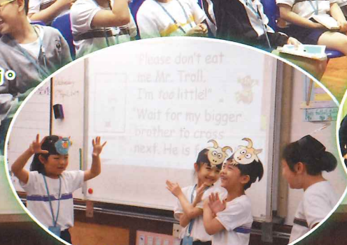
看我們故事角色扮演多投入