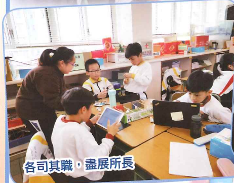
各司其職，盡展所長