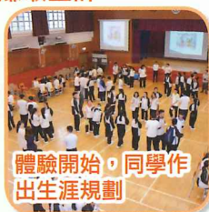
體驗開始，同學作出生涯規劃

學校特別為同學安排了「勇往直前」模擬生涯體驗活動，讓同學體驗模擬考試、進修、面試、工作來賺取生計，活動中有不同的行業供同學選擇，讓他們發掘自己的性格特質及學習其工作的所需技能，初嚐職場生活中的樂趣與辛酸，同學表現相當投入。最後，導師亦勉勵同學勇敢面對將來的逆境，樂觀接受社會挑戰。