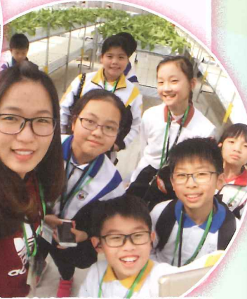
河源考察團讓五年級同學更認識內地的水利建設與文化。