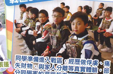
同學準備進入戰區，經歷做俘虜、痛失財物、與家人分離等真實體驗，部分同學害怕得哭起來。