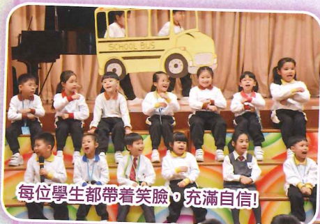
每位學生都帶着笑臉，充滿自信！