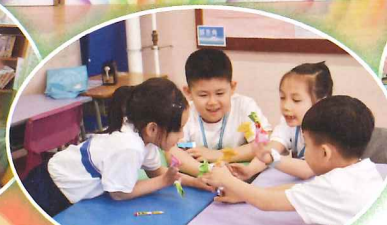
P1、P2同學很享受他們的手指偶DIY劇場