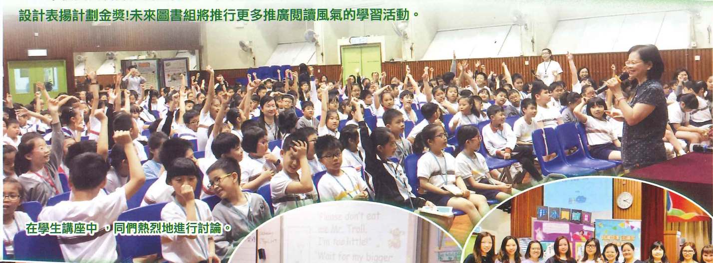
在學生講座中，同們熱烈地進行討論。