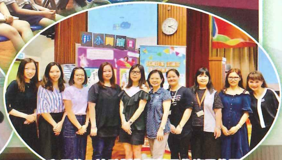
家長義工協助製作閱讀日物資及佈置裝飾，發揮了家校合作的強大力量。