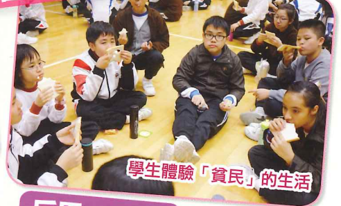
學生體驗「貧民」的生活