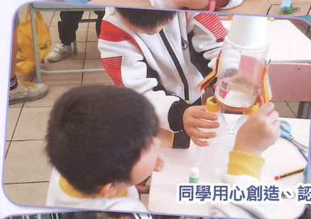
同學用心創造，認真測試自己製作的玩具