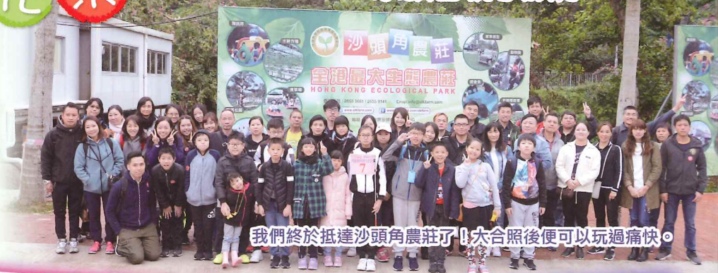
我們終於抵達沙頭角農莊了！大合照後便可以玩過痛快。