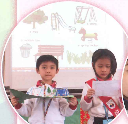
對香港公園進行資料搜集後，一年級同學設計自己的理想公園，並用英語進行匯報。