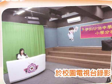
於校園電視台錄影，主持「伊分真的愛你點唱站」