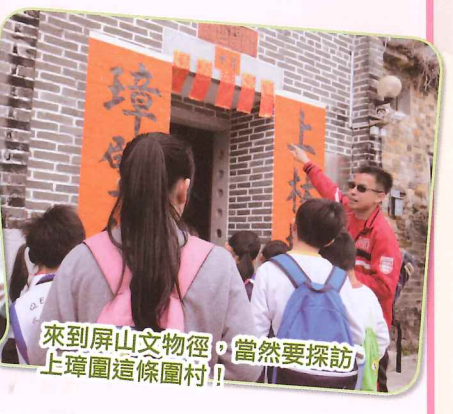
來到屏山文物徑，當然要探訪上璋圍這條圍村！