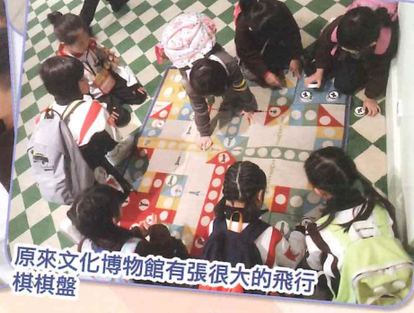
原來文化博物館有張很大的飛行棋棋盤