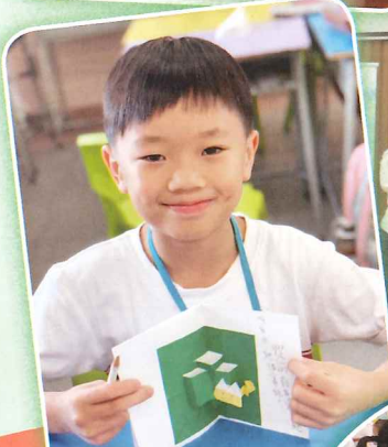
P3學生創作故事，設計立體小書。