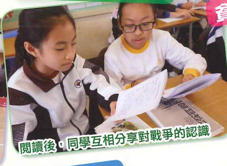
閱讀後，同學互相分享對戰爭的認識