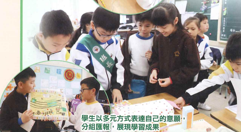
學生以多元方式表達自己的意願，分組匯報，展現學習成果