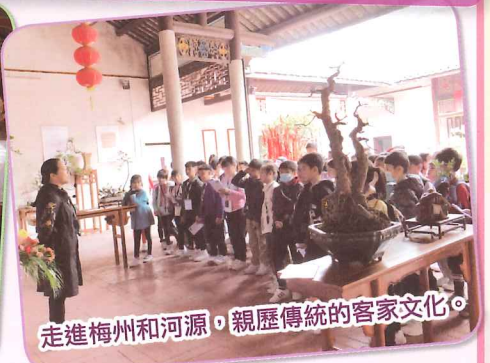
走進梅州和河源，親歷傳統的客家文化。