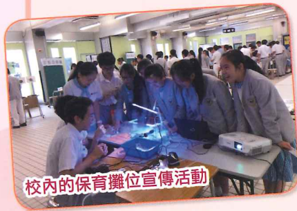
校內的保育攤位宣傳活動

學校積極推廣環保教育，本年度參加了由香港海洋公園保育基金與香港城市大學合作推行的「馬蹄蟹校園保育計劃」，由生物科牽頭，與不同學科協作，以馬蹄蟹為主題，設計教材，除了讓學生了解瀕危物種馬蹄蟹以外，學生更可以親自於校園內飼養馬蹄蟹。通過於校內外的攤位活動，向同學及社區宣揚環保意識，將環保及維持生物多樣性的概念，由學校層面，推廣至社區層面，攜手同心保護野生動物，讓大眾領會到懂得生命、尊重生命和珍惜生命的重要。