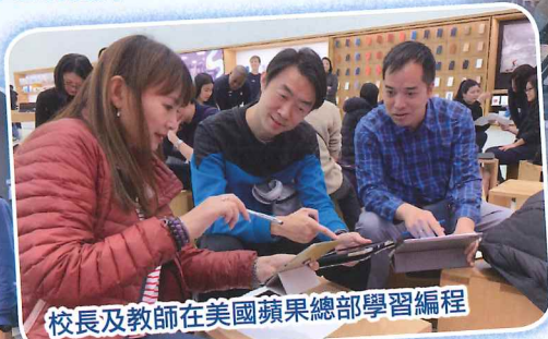
校長及教師在美國蘋果總部學習編程