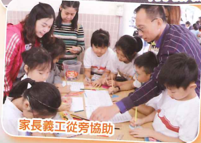
家長義工從旁協助