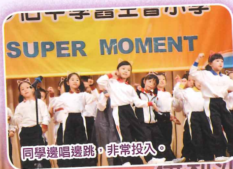
同學邊唱邊跳，非常投入。

為了增強班內的凝聚力、建立學生的歸屬感，本年度班級經營組舉辦「伊小Super Moment」，透過多元化的班本表演環節，提升學生的成就感及自信。學生參與度極高，投入感強，活動過程亦能增強同學的團結精神，提升學生對班的歸屬感，建立師生關係。