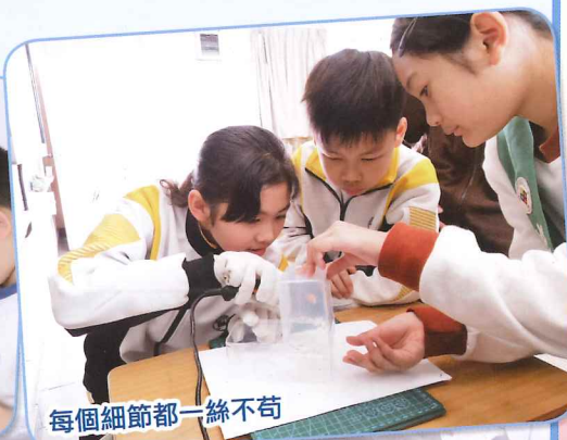
每個細節都一絲不苟