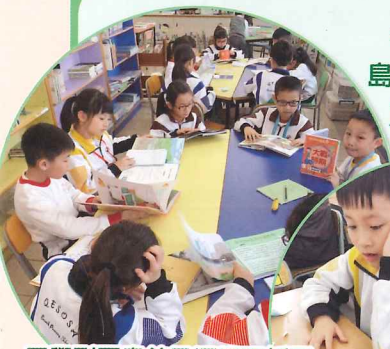
同學到圖書館及運用平板電腦進行資料搜集，了解港島區的社區特色和發展