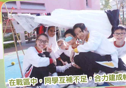
在戰區中，同學互補不足，合力建成帳篷