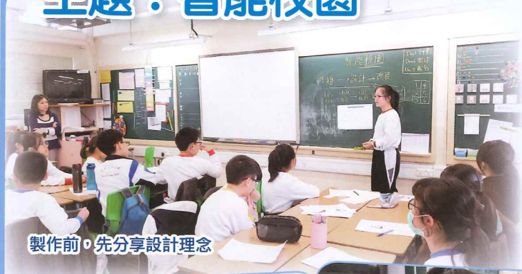
製作前，先分享設計理念

配合常識科《電與生活》主題，學生分組於校園內各地方觀察，發現難題後，合力設計及製作「智能校園產品」解決相關問題。過程中，學生需要協作，發揮創意及應用STEM和編程的能力。活動總結時，同學們有的分享難忘和自豪的片段，有的反思可改善之處，有的帶着感恩的心感謝老師和同學支持，每個學生都帶着不一樣的體會回家。