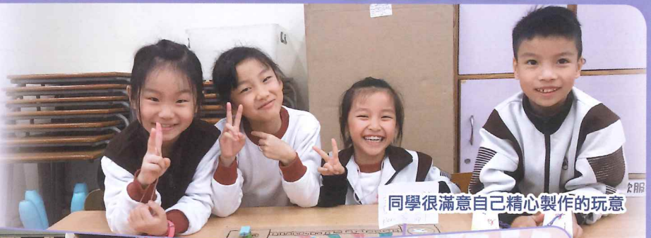
同學很滿意自己精心製作的玩意

學生到香港文化博物館參觀，認識兒時玩具。參觀後，學生從互聯網上或圖書中參考如何製作玩具。老師收到同學們自己製作的玩具車、足球龍門、劍球、紙牌、機械人、飛機等，不但帶給師生不少歡樂，還令老師們嘖嘖稱奇，原來同學們是很有創意的！