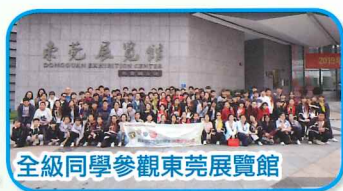
全級同學參觀東莞展覽館

短短兩日一夜，讓同學瞭解東莞高科技工業及城市規劃對當地經濟及民生的影響，更讓同學認識東莞供水工程，加強同學瞭解粵港兩地的關係。