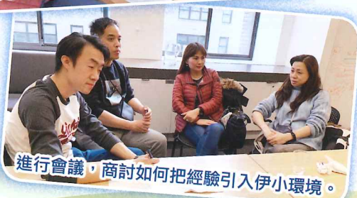
進行會議，商討如何把經驗引入伊小環境。