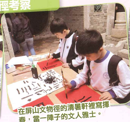
在屏山文物徑的清暑軒裡寫揮春，當一陣子的文人雅士。