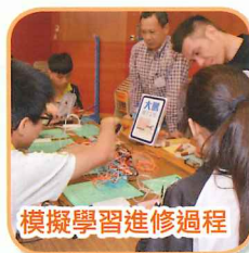
模擬學習進修過程