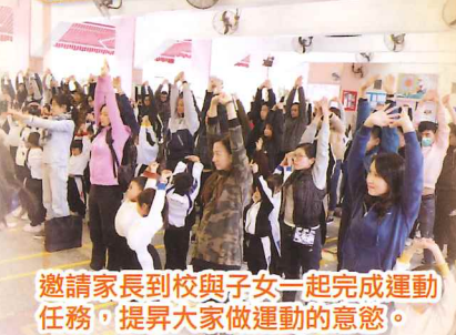
邀請家長到校與子女一起完成運動任務，提昇大家做運動的意慾。