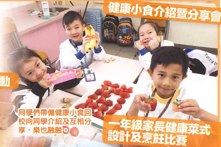
同學們帶備健康小食回校向同學介紹及互相分享，樂也融融。