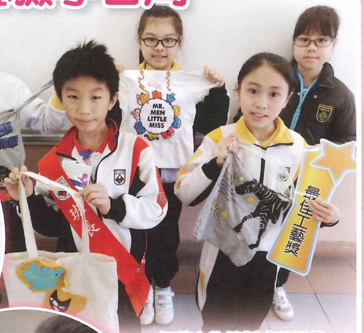
把舊衣物縫製成環保袋，「有型」又環保。