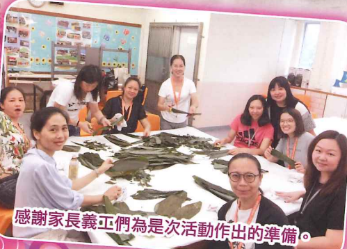
感謝家長義工們為是次活動作出的準備。