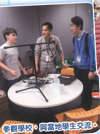
參觀學校，與當地學生交流。