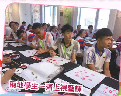
兩地學生一齊上視藝課

本校於二零一九年四月十二日至十六日舉辦了一連五日的北京交流團，三十位來自社、領袖生及校隊的領袖學生參與在內。短短五日，同學走遍北京著名古蹟，並與北京宏志中學師生進行交流，透過課堂、活動及籃球友誼賽，展現兩校之間的情誼，同學們均表示機會難得，獲益良多。