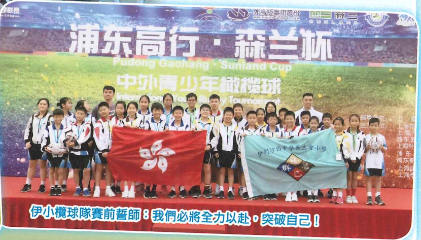
伊小欖球隊賽前誓師：我們必將全力以赴，突破自己！