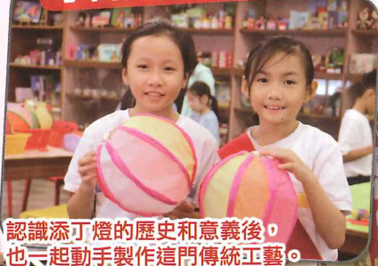
認識添丁燈的歷史和意義後，也一起動手製作這門傳統工藝。