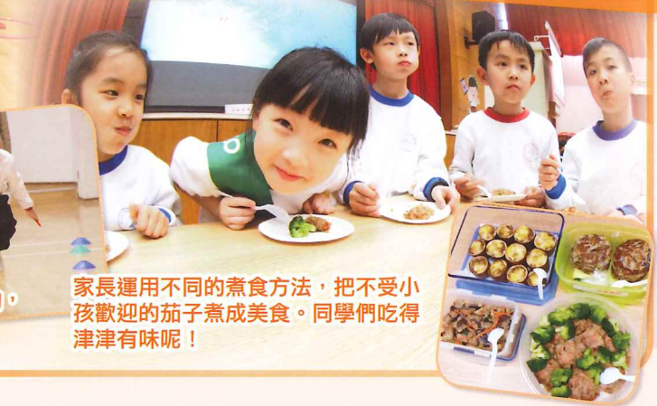
家長運用不同的煮食方法，把不受小孩歡迎的茄子煮成美食。同學們吃得津津有味呢！