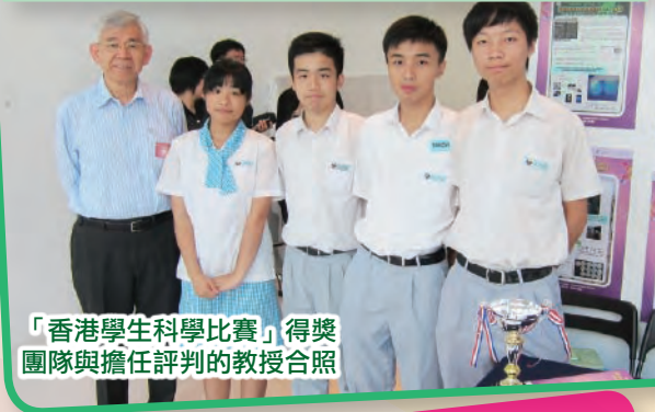
「香港學生科學比賽」得獎團隊與擔任評判的教授合照