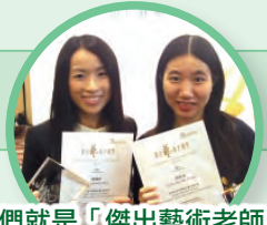
我們就是「傑出藝術老師」!