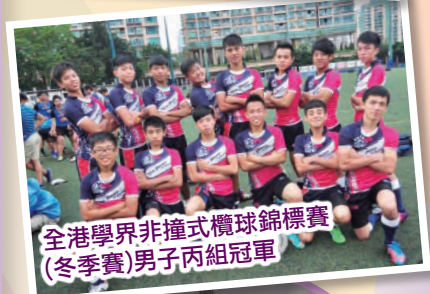
全港學界非撞式欖球錦標賽(冬季賽)男子丙組冠軍