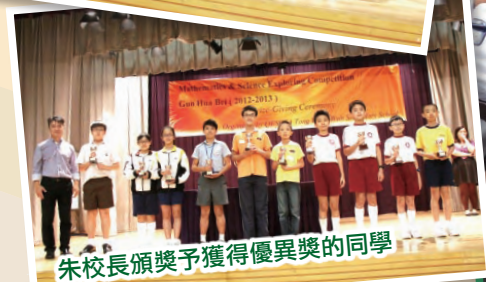
朱校長頒獎予獲得優異獎的同學