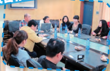
家教會主席及理事與兩所小學的家長彼此交流家校合作的經驗。