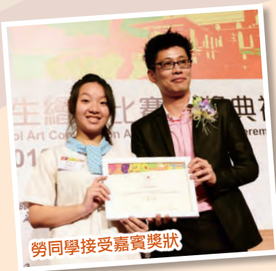
勞同學接受嘉賓獎狀

此外，伊中中同學全年在13個藝術比賽中，獲得48個獎項，獲獎人次超過50人。以下為下學期獲獎名單：