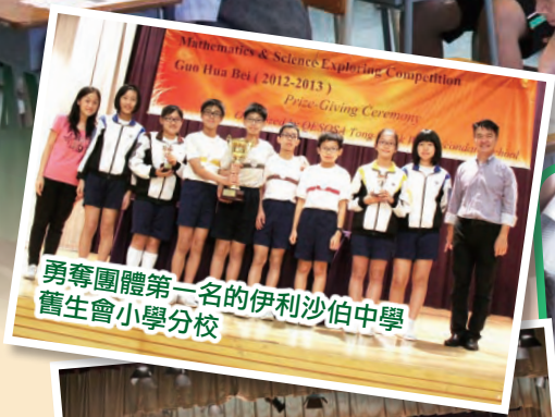
勇奪團體第一名的伊利沙伯中學舊生會小學分校

是次比賽的團體第一名為伊利沙伯中學舊生會小學分校，第二名為順德聯誼總會何日東小學，第三名為東華三院鄧肇堅小學。