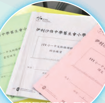
銜接課程的教材：課文、書寫練習及綜合練習。