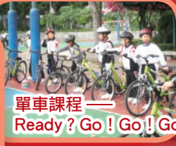
單車課程—— Ready? Go! Go! Go!