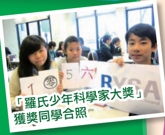
「羅氏少年科學家大獎」獲獎同學合照

伊中科學教育一向鼓勵學生將科學知識和創作意念融入生活，啟發思維及鍛鍊探索精神，成效顯著，學生經常獲公開獎項。以下為得獎項目：