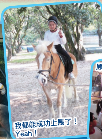
我都能成功上馬了！ Yeah!

為感謝服務生對學校付出時間為同學服務，學校特安排有傑出表現的服務生免費參觀騎術學校。讓同學認識騎術學校的運作，並一嘗策騎小馬的滋味。