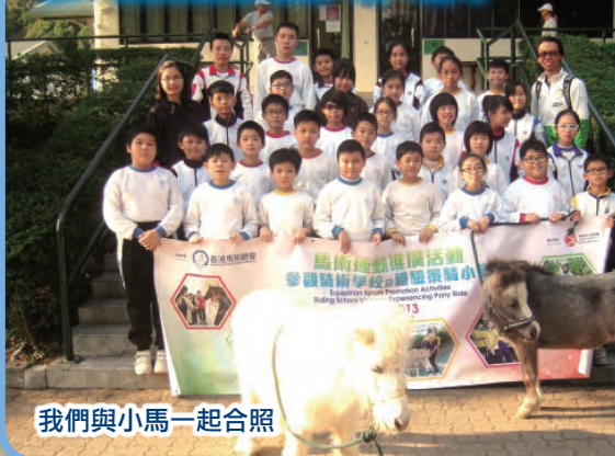
我們與小馬一起合照