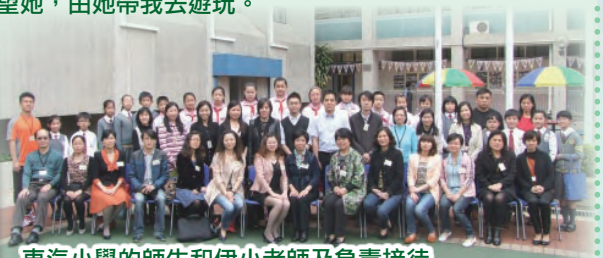
東汽小學的師生和伊小老師及負責接待的伊小大使們來一張大合照。