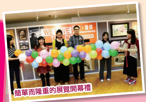
簡單而隆重的展覽開幕禮

伊中中視覺藝術展於5月4日至9日，在灣仔駱克道藝林畫廊舉行。這次展覽以「我城，我情」(We love this city)為主題，作品全部以香港發生的事件和人物為主，記錄了學生在大街小巷和舊區新景參觀時，在人群中發掘的歷史和故事。同學的作品題材豐富，有各式各樣的人物描寫、也有光怪陸離的社會事件報導，在畫布之上、顏色與筆觸之間，表達對這個城市的熱愛；對社群的關懷。