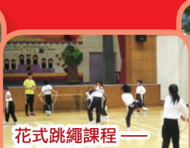
花式跳繩課程—— 活力動感