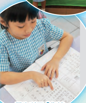
學生利用「指讀」，以集中注意力。