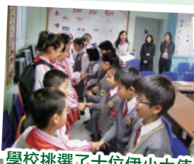
學校挑選了十位伊小大使負責接待東汽小學的同學。看！他們多認真啊！