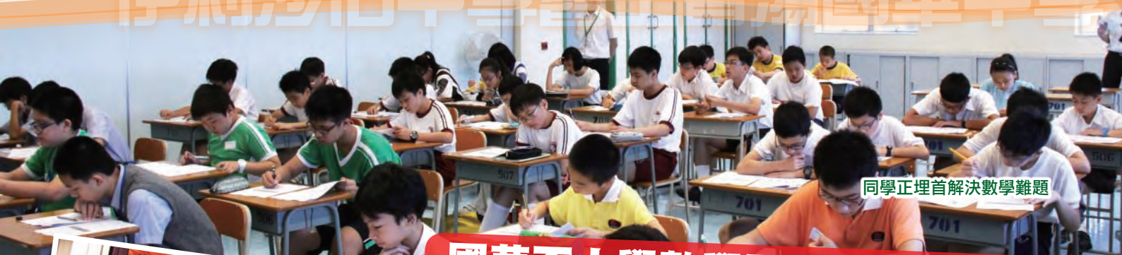
同學正埋首解決數學難題