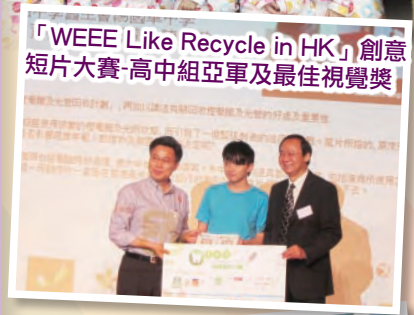
「WEEE Like Recycle in HK」創意短片大賽-高中組亞軍及最佳視覺獎