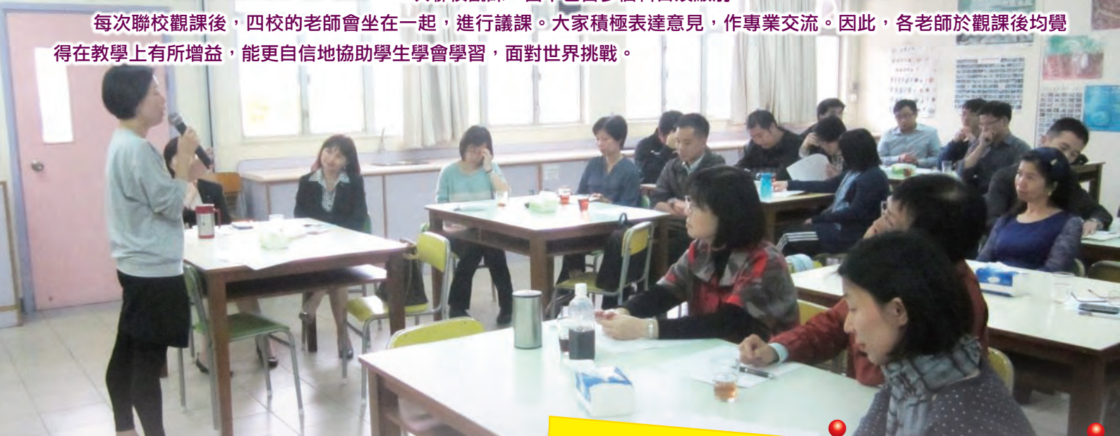
施教老師正與觀課者進行教學分析及解說。

每次聯校觀課後，四校的老師會坐在一起，進行議課。大家積極表達意見，作專業交流。因此，各老師於觀課後均覺得在教學上有所增益，能更自信地協助學生學會學習，面對世界挑戰。