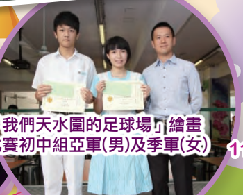
「我們天水圍的足球場」繪畫比賽初中組亞軍(男)及季軍(女)