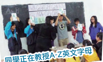
同學正在教授A-Z英文字母