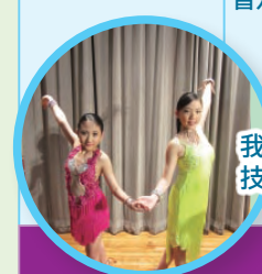
我們憑著出色的舞蹈技巧，獲得多項獎項。