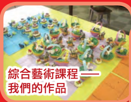
綜合藝術課程—— 我們的作品

本校於復活節假期舉辦了三天的體驗營，讓五十多位同學參加，希望同學能在課餘時發展自己的興趣，並持續學習。三天裡，同學進行了花式跳繩、綜合藝術及單車課程，他們都樂在其中，導師們亦十分讚賞同學的表現。