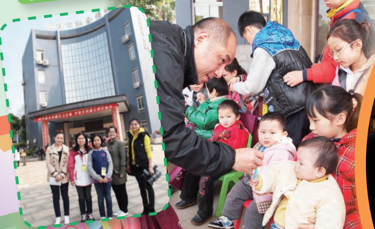
我們到湘潭市社會福利院探訪孤兒，更接受當地電視台訪問。