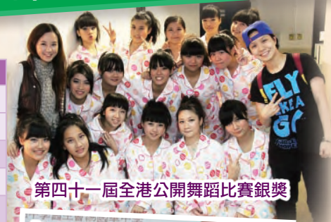
第四十一屆全港公開舞蹈比賽銀獎