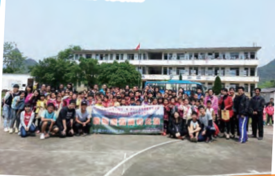
與當地人士大合照