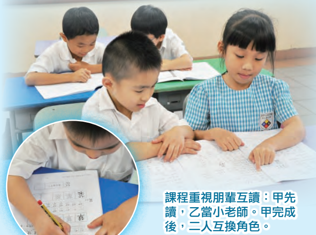
課程重視朋輩互讀：甲先讀，乙當小老師。甲完成後，二人互換角色。

本校於一年級推行「小一銜接課程」，課程由九月中旬開始，為期六週，主要是透過字詞知識、朗讀及內容理解，提升學生的字形結構意識，增加學生書寫漢字的字量和技能，繼而循序漸進地提升他們聽說讀寫的基本能力，讓剛升讀小一的學生從小便喜歡中國語文。