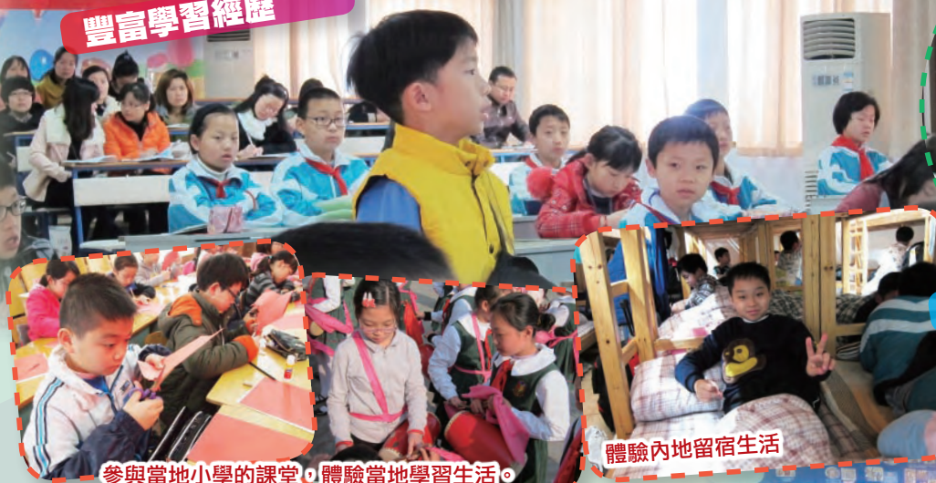
參與當地小學的課堂，體驗當地學習生活。