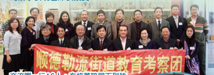
交流團一行16人，在校董陪同下到訪

二月十四日，順德勒流的黨幹部、教育局正副局長及中小學校長到訪。嘉賓透過參觀早會、校園設備，專題講座和資訊科技教學示範，增加對本港教育的認識，對本校的辦學表現也深表讚賞。