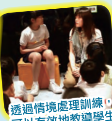
透過情境處理訓練，模特兒穿起人體背心，讓大家可以有效地教導學生面對不同的引誘。