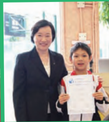
世界數學測試精英邀請賽2012

為提升學生學習數學的能力，本校成立「數學特工隊」，給予同學有系統的訓練及出外比賽的機會，讓他們發揮數學創意潛能、解決問題和互相合作，激勵同學主動鑽研數學。本年度，本校學生在世界數學測試精英邀請賽獲得小學組金獎，在數學創意解難比賽取得銅獎，以及在奧林匹克數學比賽中取得多個「一等獎」。相信，學生會繼續在數學方面追求卓越的表現。