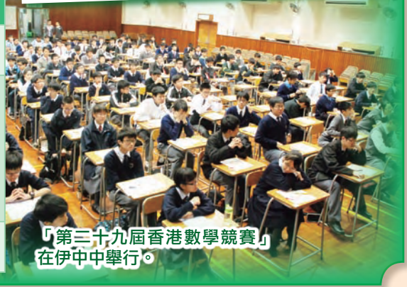
「第二十九屆香港數學競賽」在伊中中舉行。