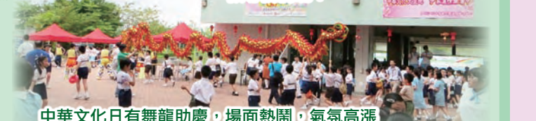
中華文化日有舞龍助慶，場面熱鬧，氣氛高漲