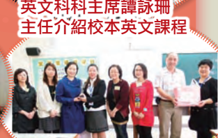
友校校長致送紀念品予家教會理事