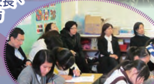
教師為學生提供清晰的寫作架構及指引，學生樂於創作