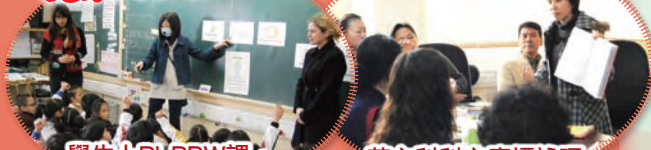
學生上PLPRW課，由3位老師指導學習