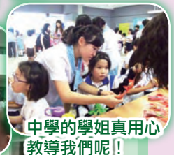
中學的學姐真用心教導我們呢！