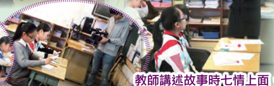
教師講述故事時七情上面，引領學生發揮創意，想像故事的發展