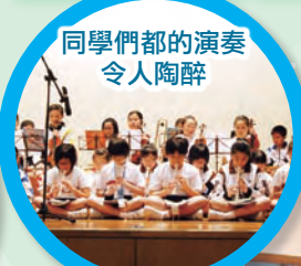
同學們都的演奏令人陶醉 這首樂曲令你想起那位名人？