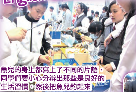
魚兒的身上都寫上了不同的片語，同學們要小心分辨出那些是良好的生活習慣，然後把魚兒釣起來