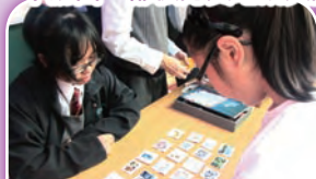
抽到問題後，同學要小心找出與題目相附的圖喎