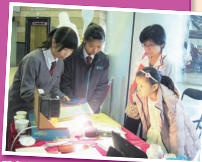
路經攤位的市民細心比較不同燈泡使用效能的數據。

同學也以展板介紹學校善用5R方式管理資源的例子，看看能否為市民低碳家居生活提供參考。