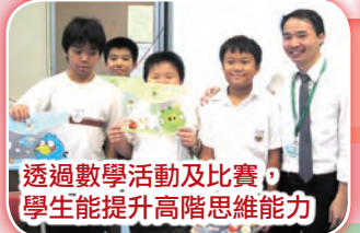
透過數學活動及比賽，學生能提升高階思維能力