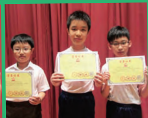
「華夏杯」全國數學奧林匹克初賽