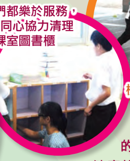
同學們都樂於服務，正在同心協力清理課室圖書櫃