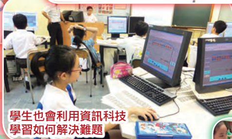
學生也會利用資訊科技學習如何解決難題