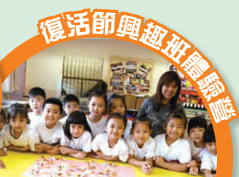
復活節興趣班 創意輕黏土課程-- 我們的作品

本校於復活節假期舉辦了三天的體驗營，讓五十多位同學參加，希望同學能在課餘時發展自己的興趣，並持續學習。三天裡，同學進行了檯球、創意輕黏土及英語等課程，他們都樂在其中，導師們亦十分讚賞同學的表現。