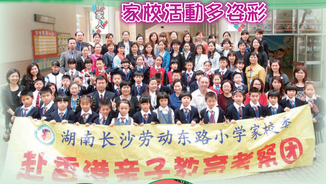
湖南长沙劳动东路小学家校委 赴香港親子考察團