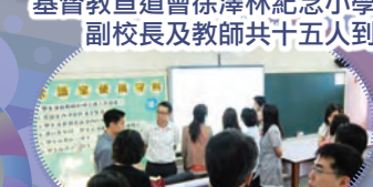
是次交流，專業、輕鬆、愉快！