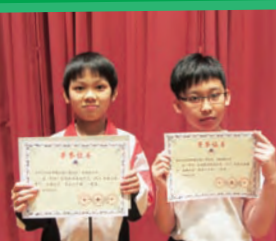
「華杯」全國數學奧林匹克2012