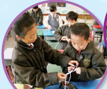
學習不忘互助，同學正互相提點打結的要點。

本訓練既重知識概念，更重實際的技能及態度。學生除了在校內積極參與課堂活動外，最重要的是在日常生活中，將所學習的技能正確地使用出來。因此，家長需要提供實習的機會，如讓小朋友協助做家务、自行執拾書包等。這樣不但可以增強他們單獨處事的信心，也能讓他們在過程中學懂分擔家庭的責任，讓我們的孩子真正成長起來。