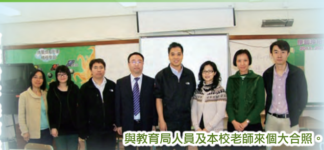
與教育局人員及本校老師來個大合照。

在伊小的日子裡，我和老師們共同備課，就某些重點的課題進行研討，針對某些問題給老師們提供一個不同的角度去分析、理解。在交流的過程中，我時常說：「我們彼此是對方的『第三隻眼』，看到我們原本自己看不到的東西。」還記得第一次觀老師的課，感覺生動、有趣，他們的基本功深厚；還記得第一次在工作坊跟老師們講的是《短除法的處理》；還記得第一次修改思維訓練工作紙的情景……老師們和我在交流的過程中互相學習，共同進步。校長和老師們的熱情，以及認真的態度也讓我倍加感動。