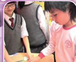
看過圖片後，同學正努力地把它名字串出來