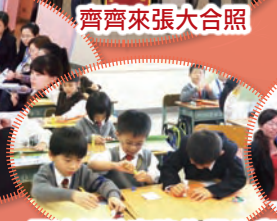
長沙勞動東路的學生與我校學生一起上視藝課