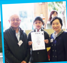
升中伯樂計劃獲音樂科銀獎