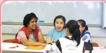
英文優才課程不但讓學生有更多運用英語的機會，更能提升他們的自信