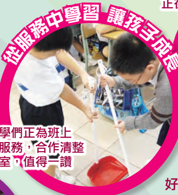
從服務中學習 讓孩子成長 同學們正為班上同學服務，合作清理課室，值得一讚