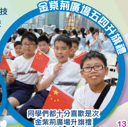
金紫荊廣場五四升旗禮 同學們都十分喜歡是次金紫荊廣場升旗禮