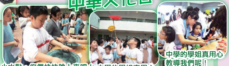
小水點，你們快快跳上來吧！中學的學姐真用心教導我們呢！