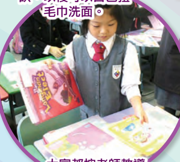
大家都按老師教導的方法執拾書包。