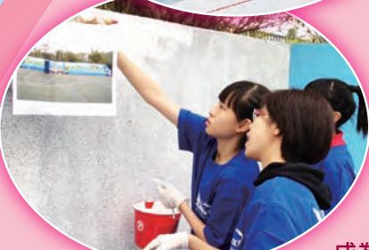
同學商議繪畫細節。

視藝科於本學年參與了由《BBG親子閱刊》與阿克蘇諾貝爾太古漆油舉辦的多樂士「Let's Colour校園添色彩計劃」。在百多所參賽的中、小學及幼稚園中，我校有幸入選12強。經過家長義工、學生及老師兩個月的努力，終於二月底完成粉飾校園的活動，並在是次比賽中奪得「亞軍」及$5,000學校發展基金，實在令人鼓舞。