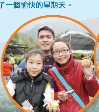
看看我們手中的麵包，那是我們在麵包工作坊親手造的!