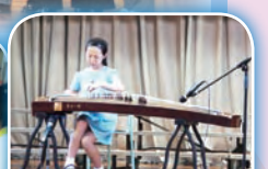
當天亦有多項表演，讓四校學生展現才能