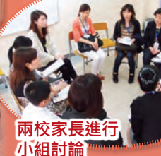
兩校家長進行小組討論