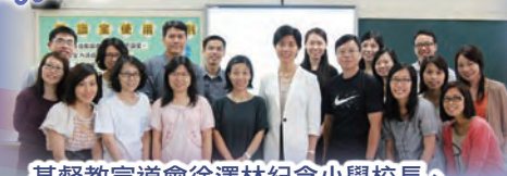
基督教宣道會徐澤林紀念小學校長、副校長及教師共十五人到訪

學校應友校之邀，再次分享在資訊科技教與學的推展與心得。當天，彼此進行專業交流，共同探討資訊科技教學的路向。