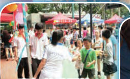
嘉年華甫開始，攤位前就人頭湧湧，不同的攤位遊戲可增加各人對四所學校的認識