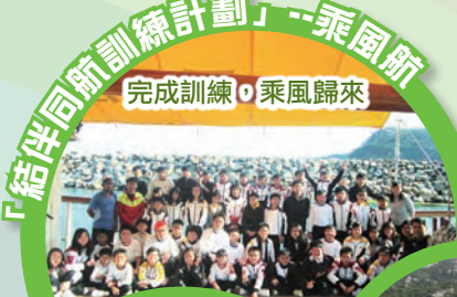
「結伴同新訓練計劃」-- 乘風航 完成訓練，乘風歸來

為了響應及支持「423世界閱讀日」，本校於4月23日舉行了閱讀音樂會。那天，同學、家長、老師和校長的臉上都掛著笑容，凝神細味著手上的《名人傳記》。之後，耳邊傳來一首首有關名人的樂曲，我們又再次進入《名人傳記》的世界去。那些樂曲的演奏者正是我校的老師和學生。