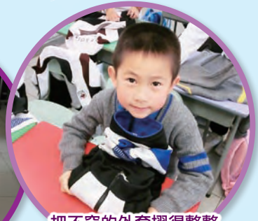
把不穿的外套摺得整齊，然後放進書包裏。