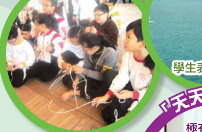
繩結是訓練項目之一 學生表現英勇

學校希望透過「乘風航」增強學生與人相處和溝通的能力，並從活動中認識自己，建立自信，勇敢地面對各項困難及挑戰。當天，五十多位學生和老師一起經歷，同學都勇於接受挑戰，完成各訓練活動。