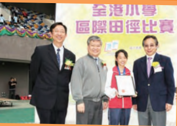
田徑場上屢獲殊榮