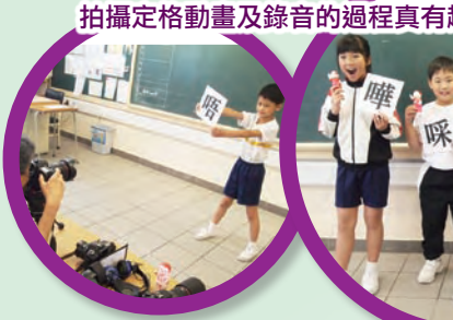
拍攝定格動畫及錄音的過程真有趣！

為提升男女童軍的步操技能及對國民身份的認同，本校參加了「金紫荊廣場五四升旗禮2012」活動，好讓學生親身體會升旗儀式。