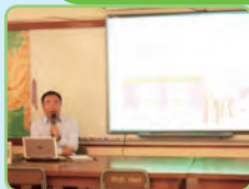
張老師正與大家分享他的教學經驗。

在伊小的日子裡，我和老師們共同備課，就某些重點的課題進行研討，針對某些問題給老師們提供一個不同的角度去分析、理解。在交流的過程中，我時常說：「我們彼此是對方的『第三隻眼』，看到我們原本自己看不到的東西。」還記得第一次觀老師的課，感覺生動、有趣，他們的基本功深厚；還記得第一次在工作坊跟老師們講的是《短除法的處理》；還記得第一次修改思維訓練工作紙的情景……老師們和我在交流的過程中互相學習，共同進步。校長和老師們的熱情，以及認真的態度也讓我倍加感動。