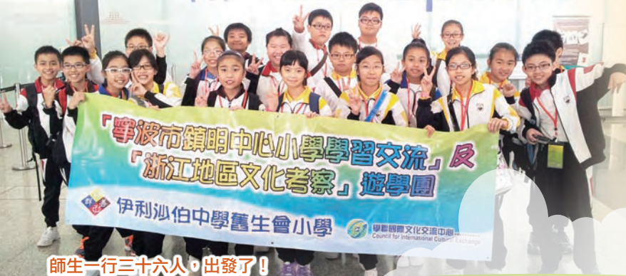
師生一行三十六人，出發了！