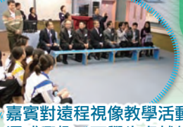
嘉賓對遠程視像教學活動深感興趣，而學生卓越的表現，也令嘉賓擊節讚賞