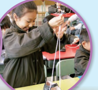
我們都懂得綁鞋帶了！