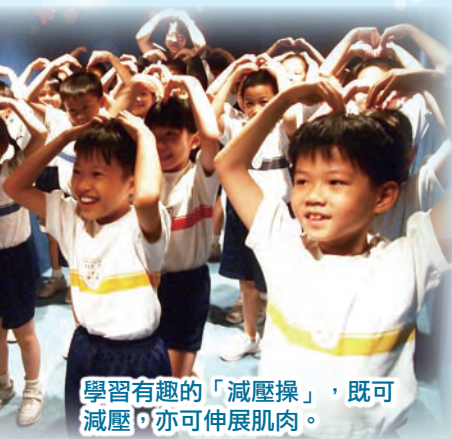
學習有趣的「減壓操」，既可減壓，亦可伸展肌肉。

「生活教育」課程主要有四個範疇，包括：身體知識、食物營養、藥物知識及社交技巧。課程的目的是按著不同年級學生的成長需要，循序漸進地培養學生的健康生活觀念及正確使用藥物的態度，從而讓學生面對藥物的引誘，有信心地說「不」。