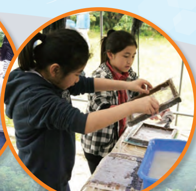
同學們正在參加再造紙工作坊，看她們多投入啊!