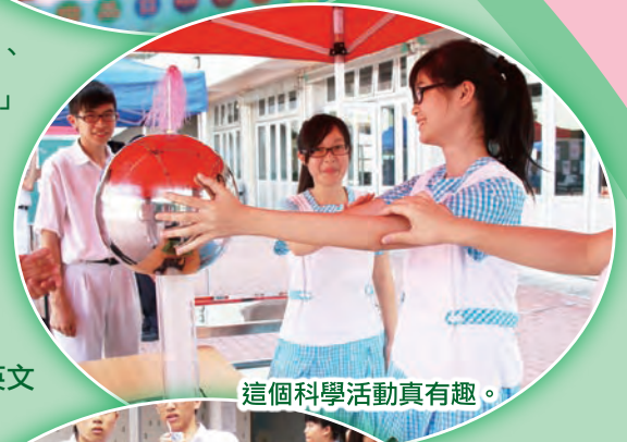
這個科學活動真有趣。

本年度的英文週為期八天，活動包括英文辯論表演賽、「一條龍」英文遊戲日、各級攤位遊戲、英語電影欣賞、初中英文拼字遊戲，迷你演唱會及「與外籍老師齊下廚」等活動。同學反應熱烈。負責的老師及同學都花了不少時間及心思，為同學增添英文的學習氣氛。活動中更有同學擔當小記者採訪，報道活動花絮。