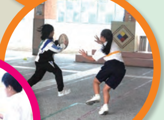
檯球課程-- 積極防守

本校於復活節假期舉辦了三天的體驗營，讓五十多位同學參加，希望同學能在課餘時發展自己的興趣，並持續學習。三天裡，同學進行了檯球、創意輕黏土及英語等課程，他們都樂在其中，導師們亦十分讚賞同學的表現。