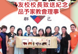
「五牛圖」寓意我校教師工作勤奮，教學水平超卓，學生成績優秀