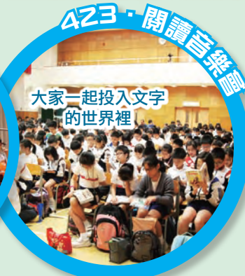
423 · 閱讀音樂會 大家一起投入文字的世界裡

為了提升學生的英語能力，本校參加了由語文教育及研究常務委員會和香港海洋公園學院合辦之「英語海洋大使及保育大使活動」。學校安排了三十位英語優良的六年級同學前往「香港海洋公園」參加是次工作坊。