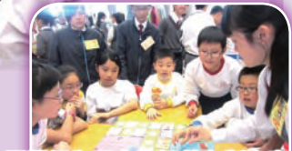
同學們為了在這個英文版大富翁中勝出，都很認真地說英語

The gestures and opinions of the NETs are quite helpful for us to achieve the performance. We really look forward to more these language learning activities.