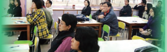
參與教師用心聆聽

資訊科技組獲教育局邀請於元朗區小學聯校教師發展日，與本區小學教師分享如何有效運用資訊科技，友校教師反應熱烈，相約六月再作更深入的探討。