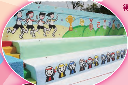
經過美化後的操場一隅。

我校一直本著「修己善群」的精神，不論師生、家校都有良好的關係。我校本年度獲得教育局及香港基督教服務處頒發的「關愛校園」榮譽。要獲此獎項，需合符關愛校園文化的五大條件：推動關愛校園的信念(Belief)；領袖的領導才能(Leadership)；有利孕育關愛校園文化配套、制度、氣氛等環境因素(Environment)；對有需者的實質支援(Support)；樂意交流分享(Sharing)，合稱為「BLESS」。憑著家長義工、老師的努力，我校在全港百多間中學中脫穎而出，榮獲「卓越關愛校園」之「最關愛家校合作」主題大獎。