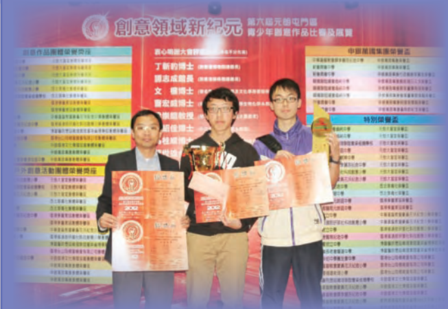
「創意領域新紀元—第六屆元朗屯門區青少年創意作品比賽及展覽」，部份得獎同學與老師合照。