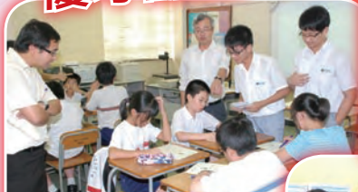
中學同學擔任小老師