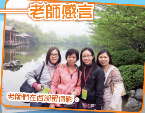
老師們在西湖留情影。

帶領學生宿營的經驗可說是身經百戰，但往香港以外的地方還是第一趟。從這次學習交流活動中，由開始時的擔心，到最後的盡興而回，感受良多。最初，由於自己是第一次到寧波、杭州等地，還要帶著一群學生，凡事總是戰戰兢兢。但當到達寧波市鎮明中心小學時，我們受到該校師生的熱情招待，所有擔憂也隨之放下。再說，看到伊小學生很快便能融入該校的學習生活，與當地學生互相交流，深感這次旅程對伊小同學來說是人生難得的經驗，並非一般的觀光交流活動可比呢！