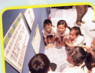
同學們一起討論毒品對人體的禍害，並學習抗絕毒品的方法。

生活教育車內置嶄新的設備，其中包括：影音儀器、發光的人體模型、身體系統燈箱、一個「會說話的腦袋」和一個名叫「譚美」的發光人體模型。利用魔術棒，「譚美」身上不同的身體部分便會發光，以加深學生的印象。此外，生活教育吉祥物「長頸鹿哈樂」及「小馬凱莉」會在課堂上跟學生說笑和唱歌，從而進一步鞏固健康訊息。