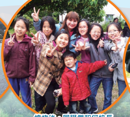
燒烤後，同學們和何校長一起拍照留念，YEAH!