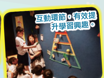
互動環節，有效提升學習興趣。