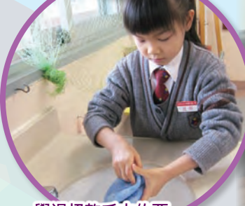
學過扭乾毛巾的要訣，以後可以自己扭毛巾洗面。