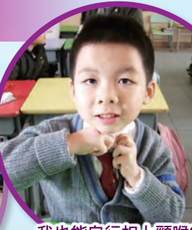
我也能自行扣上頸喉鈕了！