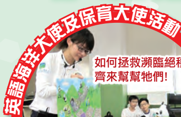
英語海洋大使及保育大使活動 如何拯救瀕臨絕種動物？齊來幫幫牠們！