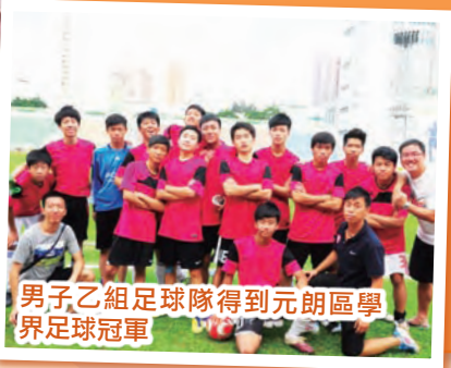
男子乙組足球隊得到元朗區學界足球冠軍。