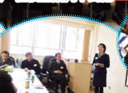
梁校長向嘉賓介紹教師考績、培訓及考績制度