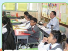
張老師正是我們的「第三隻眼」。

伊小讓我得益的不僅在於數學教學領域上，學校的管理文化、課程文化、師生的交往等工作都讓我受益良多、收穫滿滿！