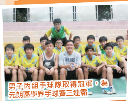
男子丙組手球隊取得冠軍，為元朗區學界手球賽三連霸。

伊中中運動員在本學年學界獲得美滿成績，獲男、女子團體總亞軍，成績非常突出。其他得獎項目如下：