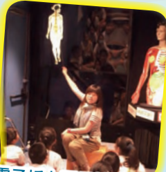
電子板上顯示神經系統的資料，同學可藉此認識到脊髓的重要性。