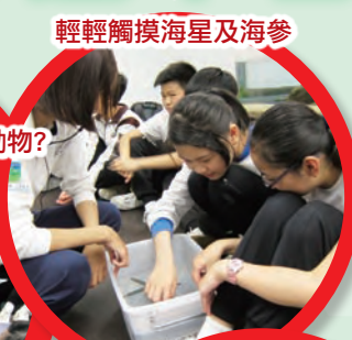
輕輕觸摸海星及海參 眾裡尋「它」- 認識不同動物的生態!