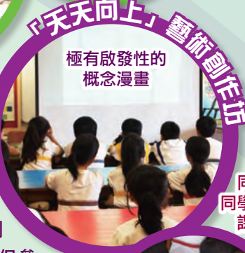
極有啟發性的概念漫畫

視藝科參與進念二十舉辦的社區校園創意拓展計劃，透過塑像創作及創意工作坊，激發學生創意。當天，學生不但參與創作及認識了當代藝術家榮念曾先生的概念漫畫，其中十多位學生更被大會挑選為活動拍攝定格動畫及錄音。