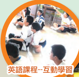
英語課程-- 互動學習

學校希望透過「乘風航」增強學生與人相處和溝通的能力，並從活動中認識自己，建立自信，勇敢地面對各項困難及挑戰。當天，五十多位學生和老師一起經歷，同學都勇於接受挑戰，完成各訓練活動。