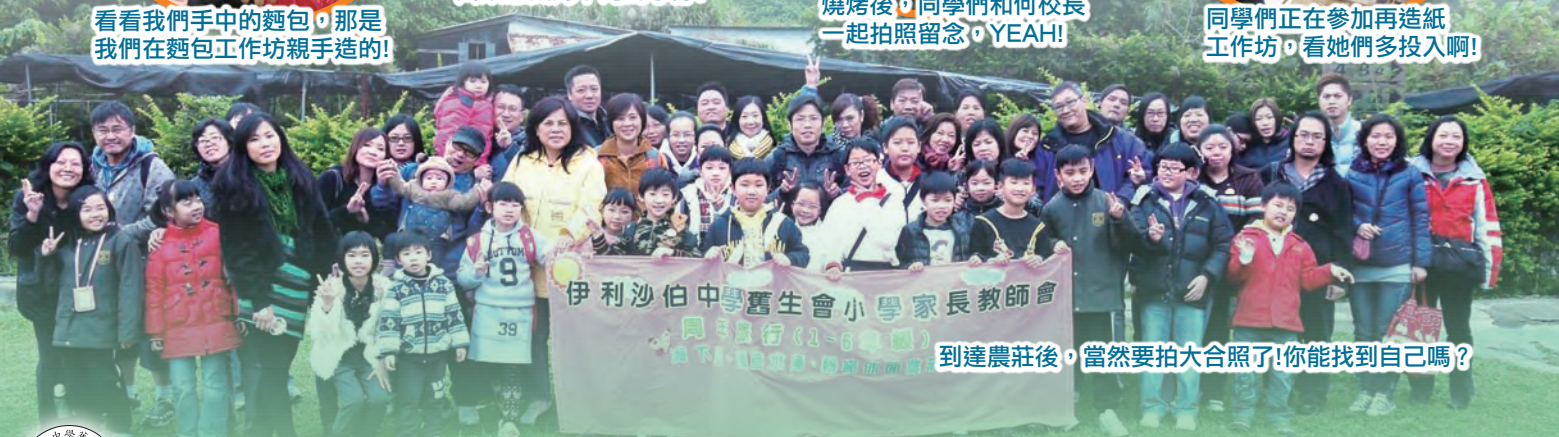
伊利沙伯中學舊生會小學家長教師會 周年旅行(1-6年級) 海下灣、萬宜水庫、農莊、西壩