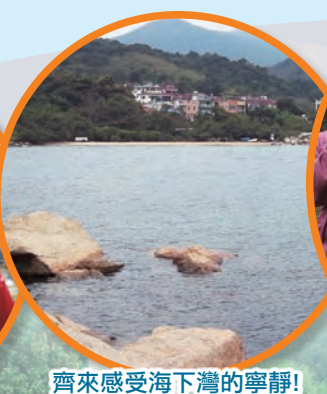
齊來感受海下灣的寧靜!