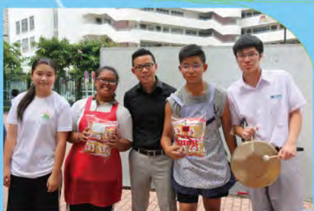
第二屆徒手開碌柚大賽

本校十分重視德育，培養同學積極進取的人生態度以及良好的品格，關顧其身心成長，以營造淳樸校風。我們希望輔助學校裡的每一個成員建立自尊和自律，並且培養彼此關懷、互相尊重的風氣。雖然學校裡所有的教職員都會分擔培育的責任，但是為了更有效照顧每一位同學的成長需要，我們會通過班主任和級聯絡老師的制度來全面推行學校的培育計劃。