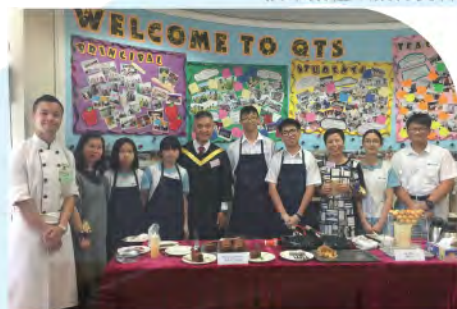
參與課後生涯規劃(蛋糕製作)課程的學生於畢業禮上招待賓客

八月下旬，學校為中一同學安排五天的暑期銜接課程，讓班主任與同學建立正面關係，並協助同學建立課堂常規，盡快適應新學年的學習節奏，讓同學適應中學的學習模式。課程內容包括中英數主科銜接課堂、學習技巧訓練、校園定向活動及師生互相認識等環節。暑期銜接課程設有頒獎環節，以表揚同學的努力投入和良好表現。