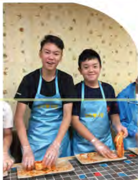
學生正在進行韓國泡菜製作

過去幾年，學校每年均舉辦不少境外交流活動，地點由中國內地到東南亞、從歐洲到澳洲、新西蘭。交流團由本校不同學科籌辦，以配合學科的學習，促進學生深化對學科的掌握，例如英文科的暑期英語交流團研習英語；地理科的考察團了解環保地質環境、環保政策及設施。