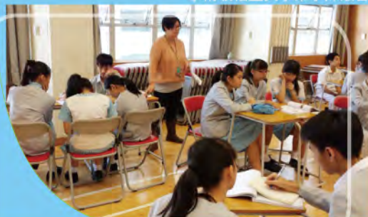
學術領袖生與學弟學妹聚會