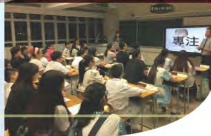
班主任與家長會面