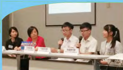
朋輩調解員分享會

本校通過正規課程、班主任課、成長課、早會，以及不同老師與同學的個別接觸，務求深入認識每一位同學，以便瞭解和調整每一位同學成長的進度。本校培育組還安排了個人和小組活動，協同學解決他們在成長路上遇到的各種困難。如果同學或家長需要任何幫助，可以首先聯絡班主任，也可約見培育組老師或駐校社工；在有需要時，我們更會聯絡其他相關機構提供支援服務。