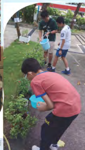
中一級參與課後支援課程的學生，協助美化校園環境