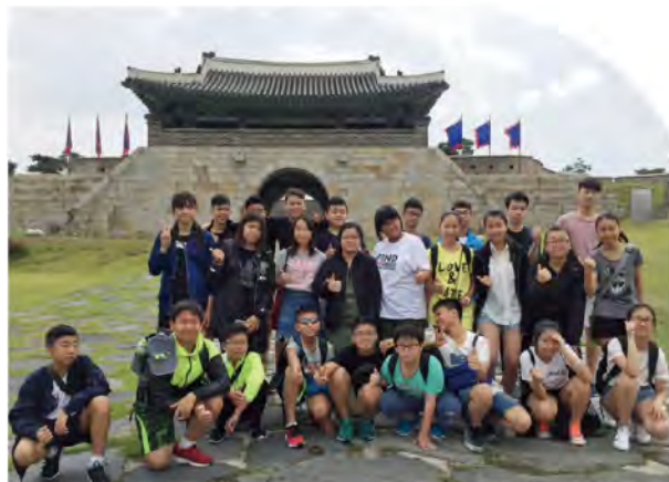
學生於韓國景點留影