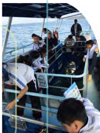
中二級到海下灣進行海洋考察