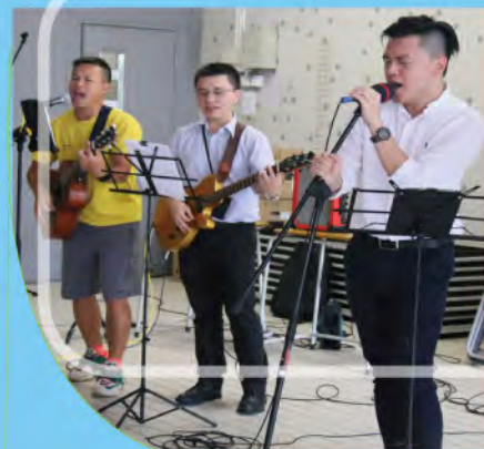
「試前為你打打氣」音樂會

本校通過正規課程、班主任課、成長課、早會，以及不同老師與同學的個別接觸，務求深入認識每一位同學，以便瞭解和調整每一位同學成長的進度。本校培育組還安排了個人和小組活動，協同學解決他們在成長路上遇到的各種困難。如果同學或家長需要任何幫助，可以首先聯絡班主任，也可約見培育組老師或駐校社工；在有需要時，我們更會聯絡其他相關機構提供支援服務。