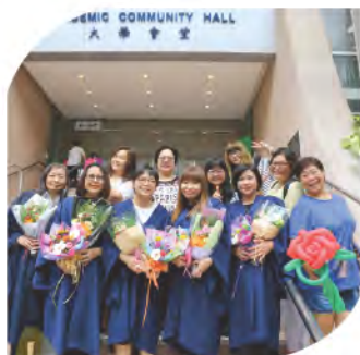
於香港漫會大學會堂舉行的 「自在人生自學計劃」畢業典禮

本校一直鼓勵家長積極參與義務工作，以加強學校與家長之間的溝通，也可藉此與同學多接觸，陪伴同學一起成長，建立良好的親子關係。