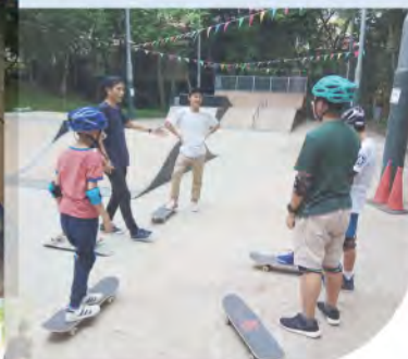
學生參與課後支援課程