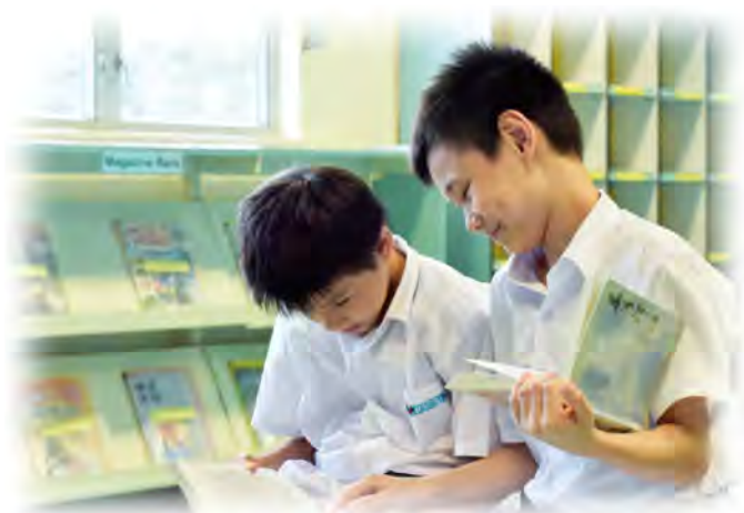
學生在圖書館裡閱讀